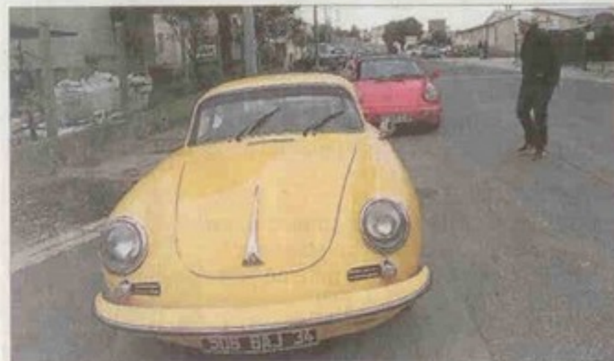
■ Cette 356, premier modèle de la marque, a pris la tête du convoi. G. M.

conviviale d'une centaine de kilomètres jusqu'à Ganges, via Saint-Mathieu-de-Trévières, avec étape repas au mas de Baumes, à Ferrières-les-Verrières, puis retour par Sommières. Honneurs aux aînées: une 356 et d'autres modèles avec refroidissement par air ont été placées en tête du convoi.