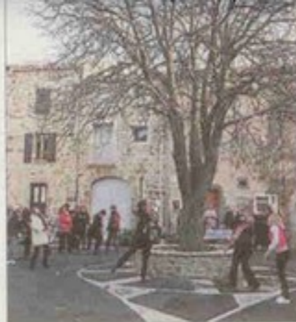
■ Pas facile d'accrocher ses vœux.